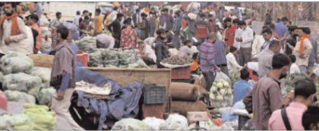
चंडीगढ़, 17 अप्रैल (जनसत्ता)।